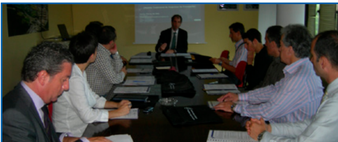
Imagen de la sesión celebrada en ZAISA (Irún).

También se demostró que los transportistas dispuestos a protagonizar este salto cualitativo podrán comprobar que la migración del viejo al nuevo modelo comportará un aumento del número de operaciones y evitará la pérdida de clientes y competitividad.